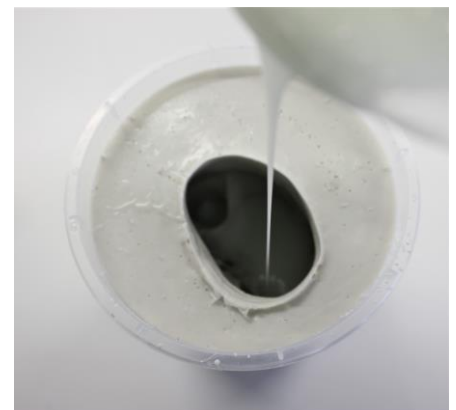
Fig. 5: De siliconen worden met een dunne straal in de mal gegoten.