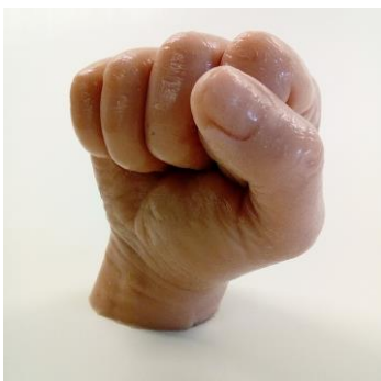
Fig. 6: voorbeeld eindresultaat.