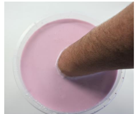
Fig. 4: De hand wordt, in de juiste positie, voor 5 minuten stil gehouden.