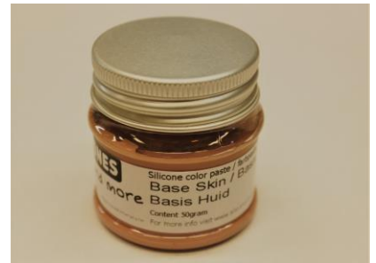
Fig. 2. We voegen 0,5 % kleurstof toe aan de A component. (0,5 % van 500 gram is 2,5 gram)